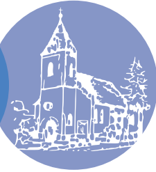
St. Johannes-Gemeinde Rodenberg